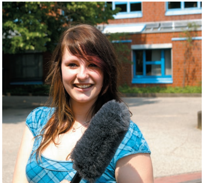
Vor der Kamera: Eine Schülerin beim Workshop in Geesthacht

Neben Userbeiträgen finden Besucher des Portals auch Informationen zu Erinnerungsorten sowie sorgfältig aufbereitetes Unterrichtsmaterial zur Geschichte der DDR auf der Internetseite. Behandelt werden Themen wie „Opposition und Widerstand“, „Stasi und Spionage“ und „Familie, Jugend und Schule“. Alle Lernmaterialien – Audio- und Videobeiträge, Dokumente, Arbeitsblätter und Aufgaben – stehen jedem Nutzer kostenlos zur Verfügung. Besonderer Beliebtheit erfreuen sich auch die „Vor-Ort-Angebote“ des Projekts „Deine Geschichte“. So veranstaltet das „Deine Geschichte“-Team deutschlandweit regelmäßig Workshops, die Schüler und Lehrer mit dem Online-Angebot des Projekts bekannt machen sollen und in denen die Teilnehmer selbst kurze Zeitzeugen-Interviews trainieren und mit Videokamera-Einsatz produzieren. Die positive Resonanz auf diese Seminare zeigt, dass Jugendliche mit den richtigen Mitteln leicht für Geschichte zu begeistern sind. Die vor und hinter der Kamera gesammelten Erfahrungen bezeichnen Schüler und Lehrer gleichermaßen als äußerst gewinnbringend. Alle Teil-