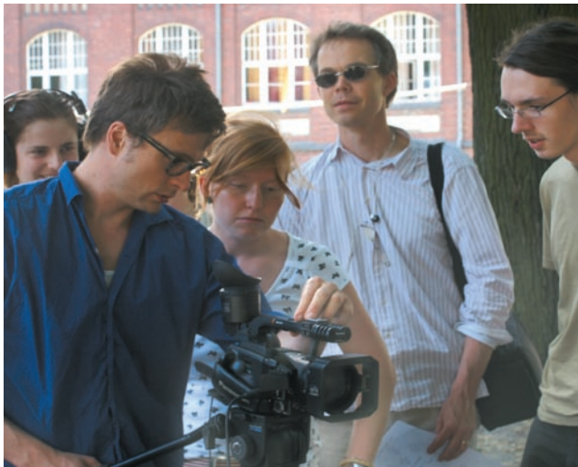
Kameraeinweisung beim Workshop in Hermannswerder

Unmengen von Video- und Audiodateien, Fotos und Texten auf Portale wie YouTube oder SchülerVZ hoch. Nicht wenige benutzen Schnitt- oder Bildbearbeitungsprogramme, um ihren Beiträgen den letzten Schliff zu geben. Hier knüpft das Onlineportal www.deinegeschichte.de an. Unter dem Motto „Lernen – Machen – Publizieren“ ruft „Deine Geschichte“ Schüler aus ganz Deutschland dazu auf, die Geschichte der DDR und der deutschen Teilung selbst zu entdecken, eigene Geschichten zu recherchieren, Interviews mit Zeitzeugen zu führen, Video-, Audio-, Foto- oder Textbeiträge zu produzieren und auf dem Portal zu publizieren. Dabei erfährt der User auf deinegeschichte.de nicht nur, wie man Interviews, Reportagen oder andere Beiträge vorbereitet, welche Hilfsmittel man zur Umsetzung braucht und wo man Mikrofone, Kameras u.ä. ausleihen kann. In kurzen, leicht verständlichen Videotutorials finden die Nutzer auch Tipps zur Nachbearbeitung ihrer Beiträge. Darüber hinaus setzt sich „Deine Geschichte“ für einen differenzierten, kritischen Umgang der Schüler mit den medialen Inhalten ein – eine Kompetenz, die für eine lebendige Demokratie unverzichtbar ist.